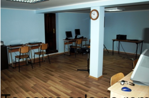
To sama sala po remoncie