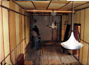
Korridor na piętrze przed remontem ...