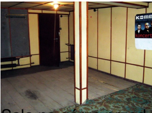
Sala na górze przed remontem ...

Niedziela, 13 Listopad 2011 19:38 - Zmieniony Niedziela, 25 Listopad 2012 10:09