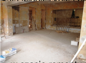
... w czasie remontu ...