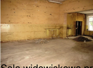
Sala widowiskowa przed remontem ...