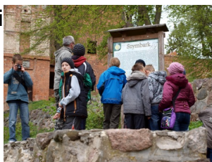
Przed tablicą informacyjną