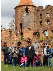
Uczestnicy pleneru fotograficznego w zamku szymbarskim