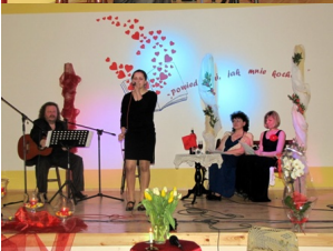
Antyca Biżopolska i Romasza Śpiewalica i Dwajęca wieczór, na gitarze